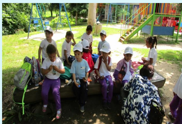
В парк „Кайлъка“