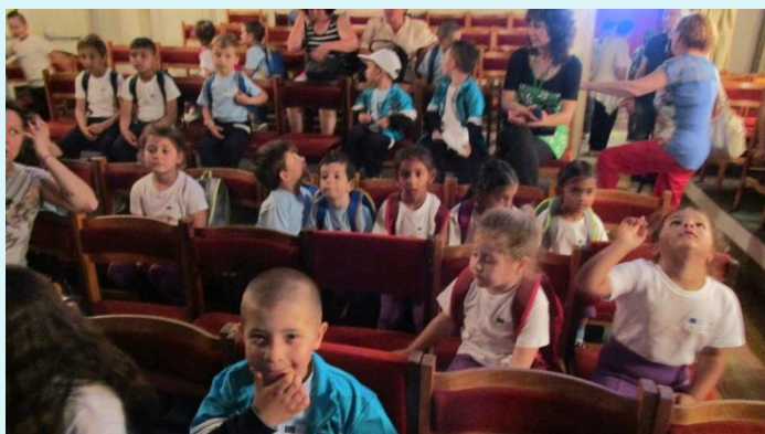
Минути преди да започне кукления театър