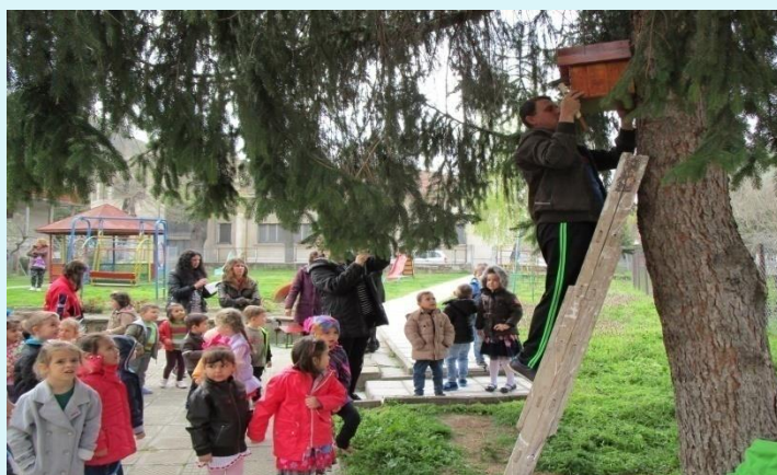
Поставяме къщички за птиците