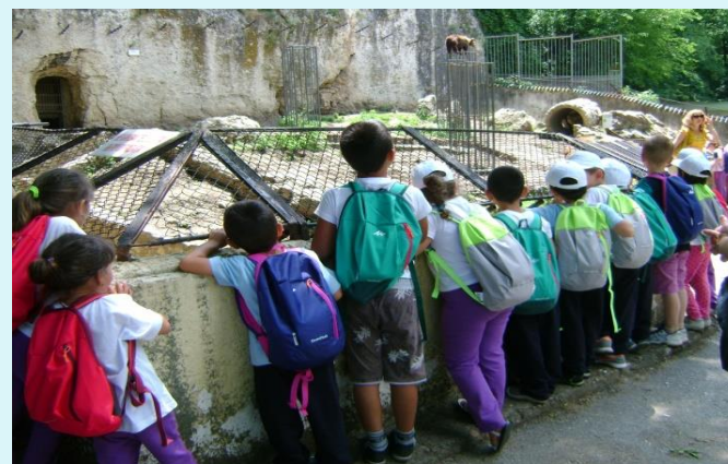
В зоологическата градина