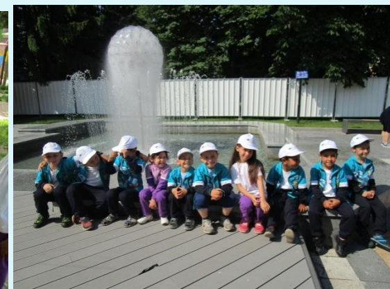
Почивка в центъра на града