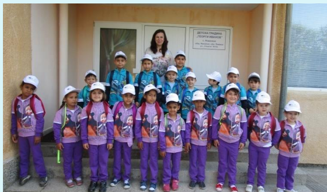
Вече сме готови за екскурзия